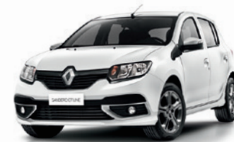
(369) Blanco Glaciar