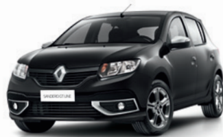
(676) Negro Nacré