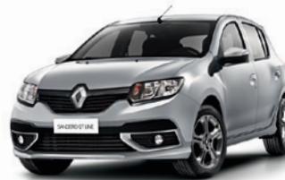
(KNH) Gris Estrella